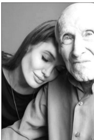
朱莉与詹佩里尼《坚不可摧》

在迪士尼的展示中,最令人耳目一新的是旗下皮克斯公司(Pixar)计划在2015年上映的动画片《Inside Out》(直译“里朝外”)。